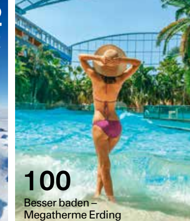
100 Besser baden – Megatherme Erding