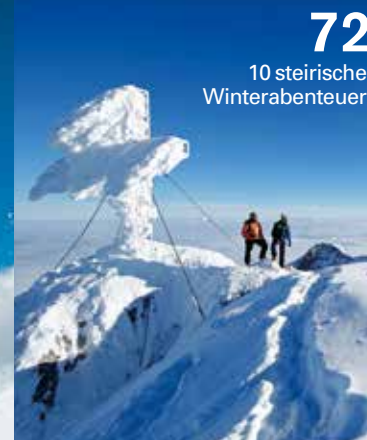
72 10 steirische Winterabenteuer