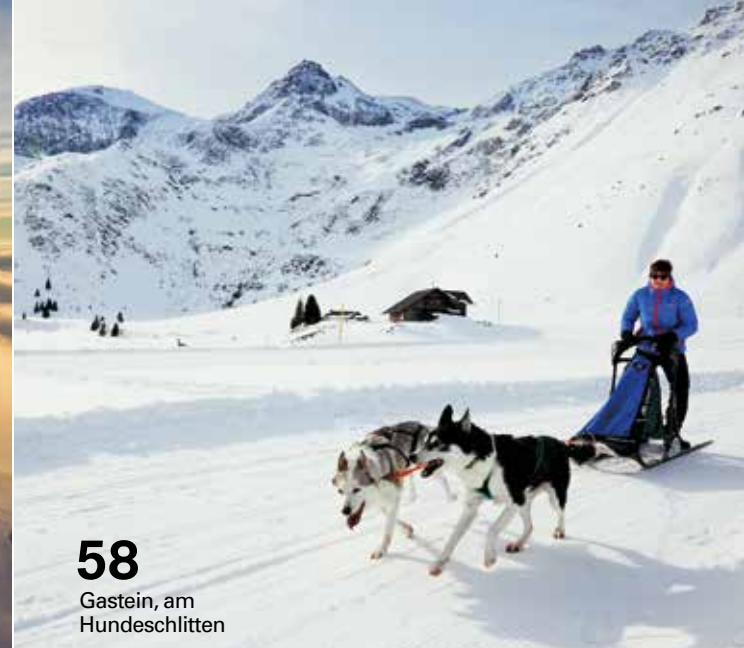
58 Gastein, am Hundeschlitten