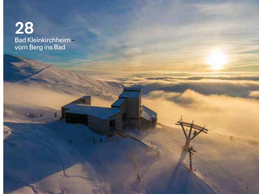
28 Bad Kleinkirchheim – vom Berg ins Bad