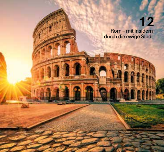
12 Rom – mit Insidern durch die ewige Stadt