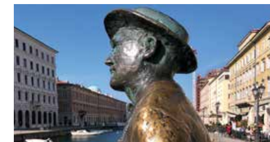
Unser erster „Kurztrip“ führt nach Triest, wo wir diesem Herrn begegneten