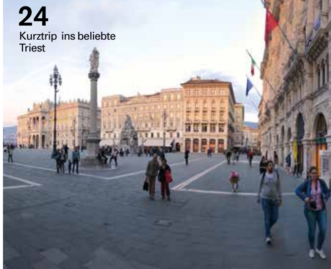
24 Kurztrip ins beliebte Triest