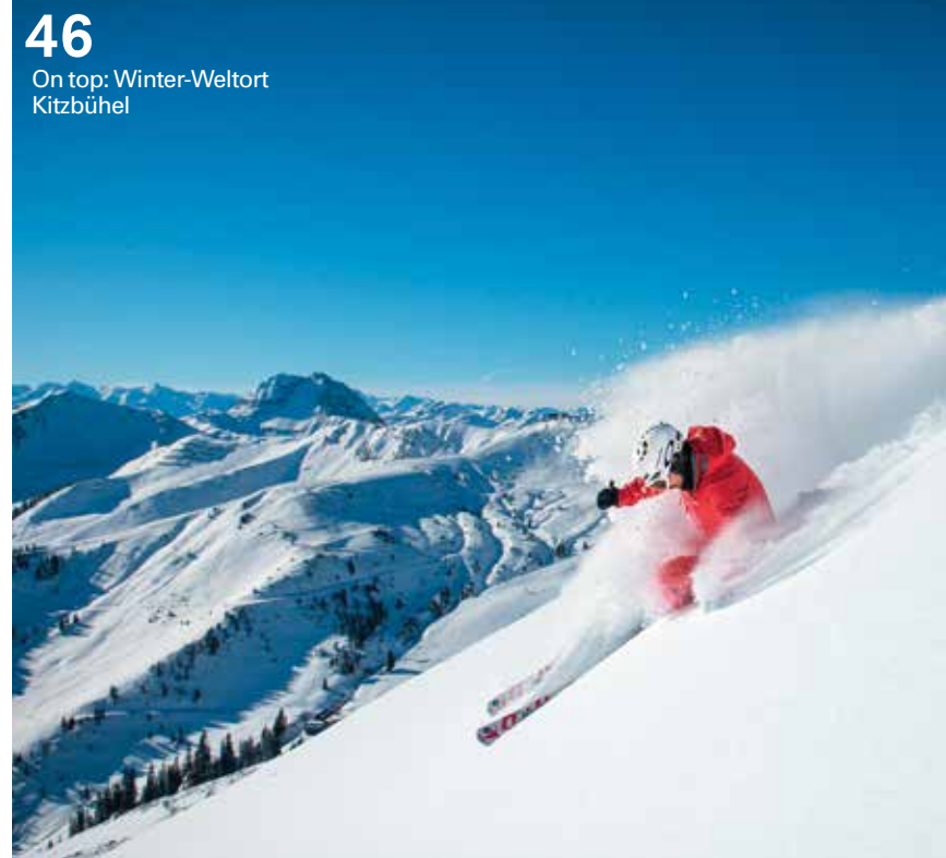
46 On top: Winter-Weltort Kitzbühel