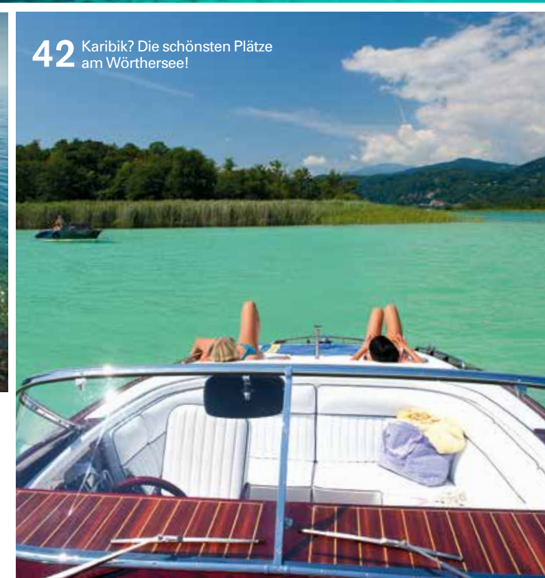
42 Karibik? Die schönsten Plätze am Wörthersee!