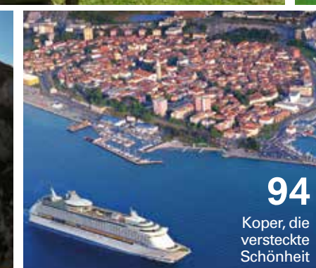
94 Koper, die versteckte Schönheit