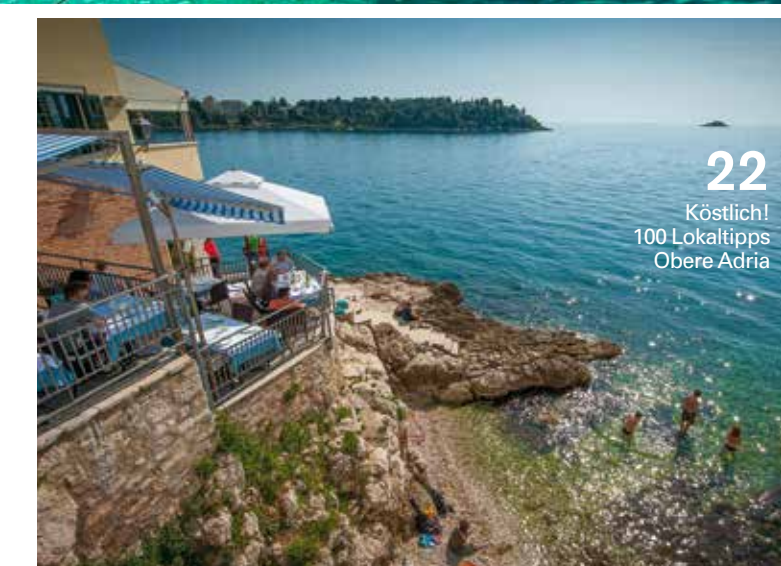
22 Köstlich! 100 Lokaltipps Obere Adria