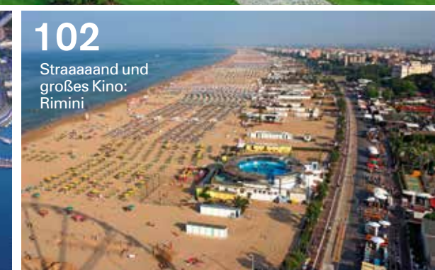
102 Straaaaaand und großes Kino: Rimini