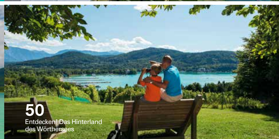
50 Entdecken! Das Hinterland des Wörthersees