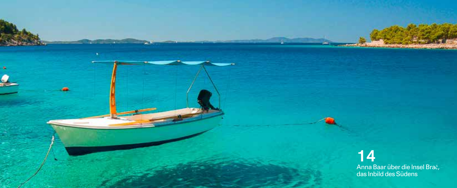
14 Anna Baar über die Insel Brač, das Inbild des Südens