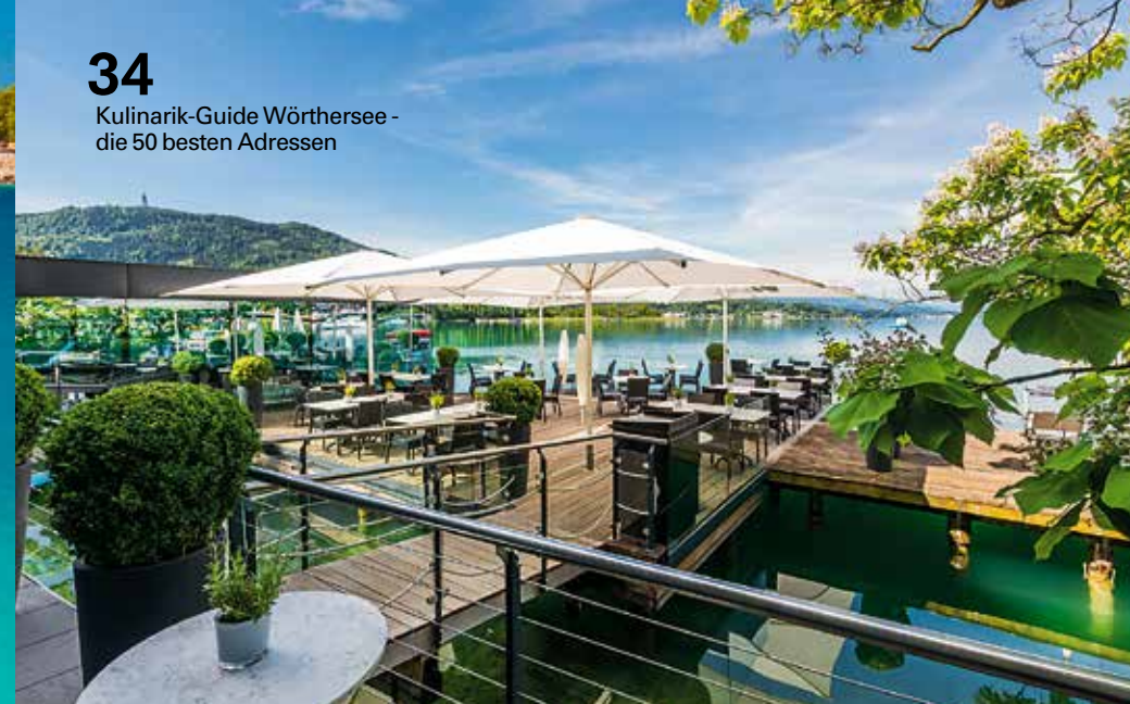
34 Kulinarik-Guide Wörthersee - die 50 besten Adressen