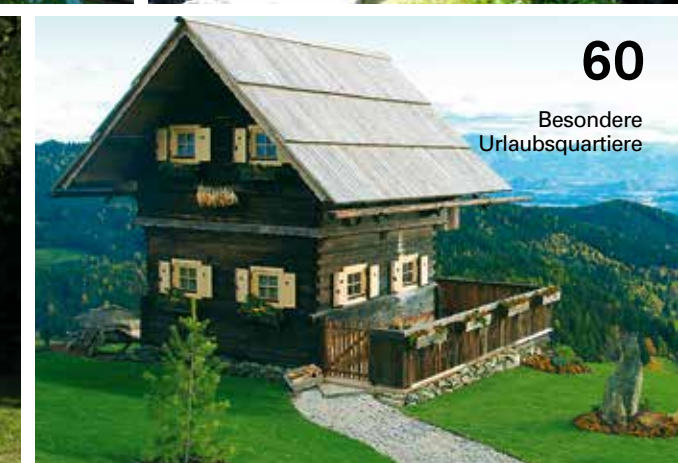
60 Besondere Urlaubsquartiere