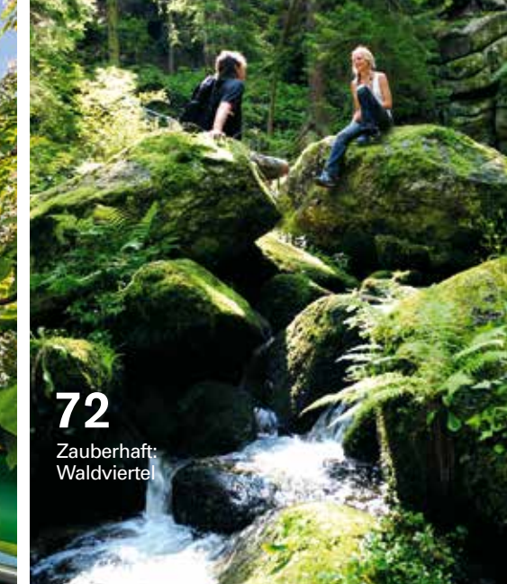
72 Zauberhaft: Waldviertel